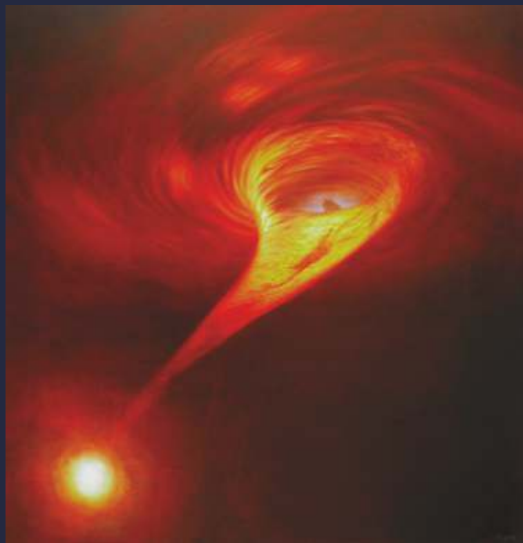
▲ Dalibor Vajnar, Nekonečný bod II (olej na desce, 2004, 63x65 cm)

Každé vyjádření je příliš hrubé, každý popis nepřesný. Mnohost a rozmanitost světa spěje k jedinému cíli - i vlny a vlnky se vracejí do oceánu, který ve skutečnosti nikdy neopustily. Tak jako ty.